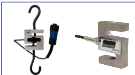
Ref. ZPT100C Ref. Z818318