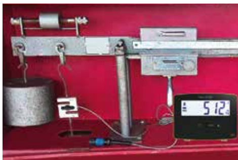
Conversión de mecánica a electrónica