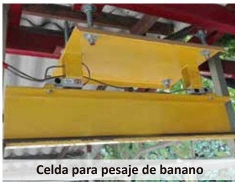
Celda para pesaje de banano