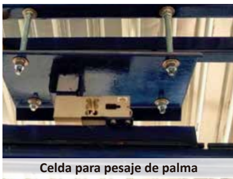
Celda para pesaje de palma