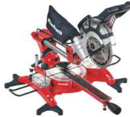
Ingleteadora Telescópica de 8" TC-SM 2131 1500 Watts