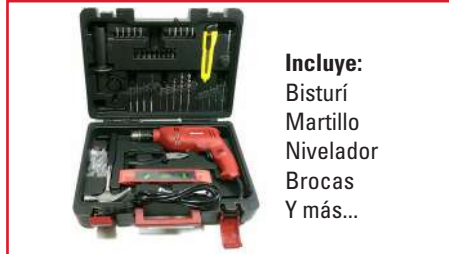
Taladro Percutor TC-ID 650 E 650 Watts + Accesorios