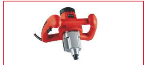
Mezclador de Pintura TC-MX 1400 1400 Watts