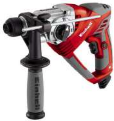
Rotomartillo SDS Plus de 3/4" RT- RH 20 600 Watts