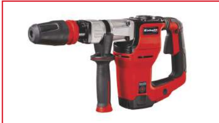
Demoledor TE-DH 12 1050 Watts