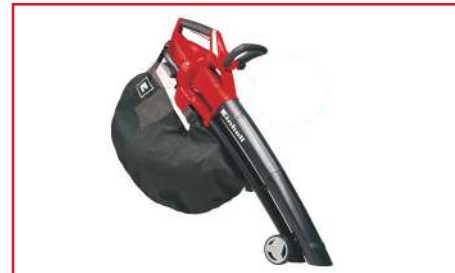
Aspiradora Sopladora de Jardín GE-CL 36 Li