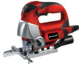
Sierra Caladora RT-JS 85 750 Watts