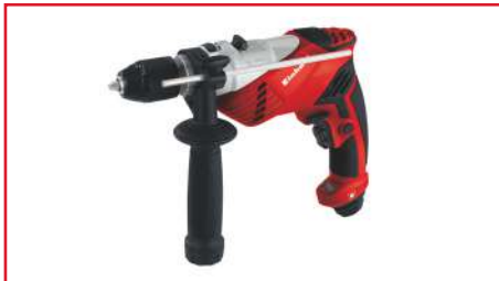
Taladro Percutor RT-ID 65 650 Watts