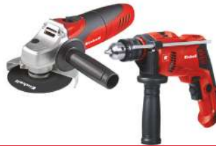
Kit Taladro Percutor 1/2" TE-ID 500 E y Minipulidora 5" TC-AG 115/850