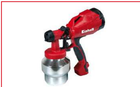
Pistola de Pintura Eléctrica TC-SY 500 S 500 Watts