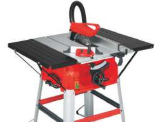
Sierra de Mesa de 10" TC-TS 2025/1 U 2000 Watts