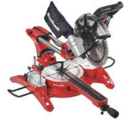
Ingleteadora Telescópica de 10" TC-SM 2534 Dual 2100 Watts