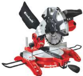
Ingleteadora Rígida de 10" TC-MS 2513 L 1600 Watts