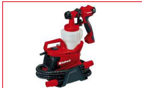
Pistola de Pintura Eléctrica TC-SY 700 S 700 Watts