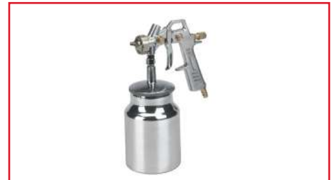
Pistola Pulverizadora para Pintura