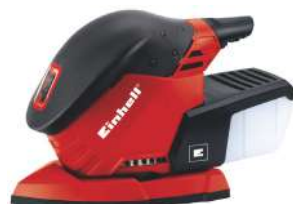
Lijadora Triangular RT-OS 30 720 Watts