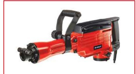
Demoledor TC-DH 1600/1 1600 Watts