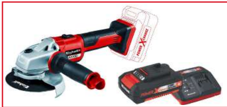
Pulidora de 5" Brushless AXXIO + Batería y Cargador