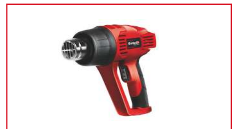
Pistola de Calor TH-HA 2000/1 720 Watts