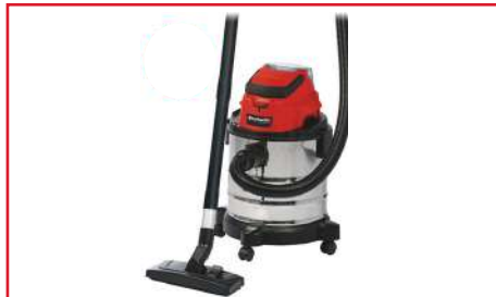
Aspiradora en Seco y Húmedo TC-VC 18/20 Li + Batería y Cargador