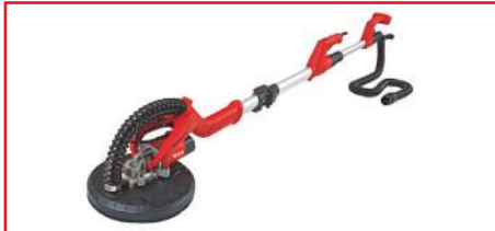
Lijadora de Altura para Drywall de 9" TC-DW 225 600 Watts