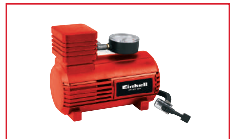
Compresor de Aire para Carro CC-AC 12V