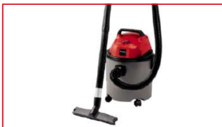
Aspiradora Seco Húmedo TC-VC 1815 1250 Watts