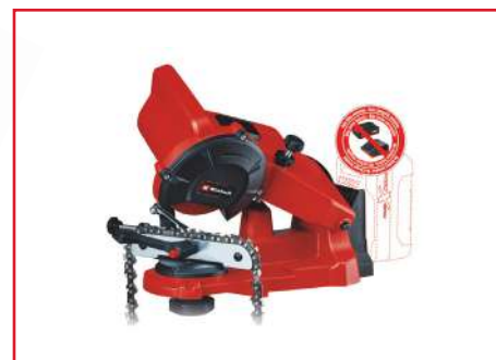
Afilador de Cadena de Motosierra GE-CS 18 Li