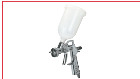
Pistola Pulverizadora para Pintura