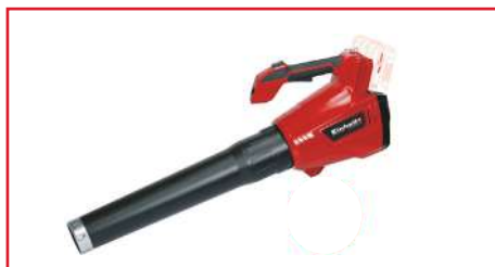
Sopladora Brushless GE-LB 36 Li