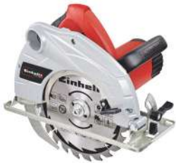
Sierra Circular de 7 1/4" TC-CS 1400/1 720 Watts