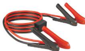
Cable Roba Corriente BT-BO 16/1