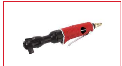
Ratchet DRS 200/2

Máx. presión de trabajo | 6.3 Pa Par de apriete | 312 Nm