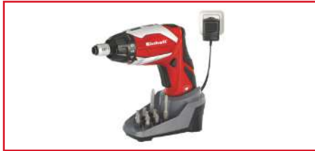
Atornillador Inalámbrico TE-SD 3.6/1 Li