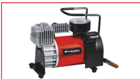
Compresor de Aire para Carro CC-AC 35/10 12V