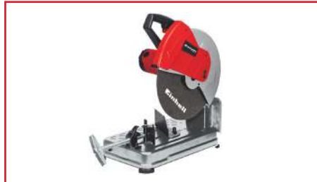
Tronzadora de Metal de 14" TC-MC 355 2300 Watts