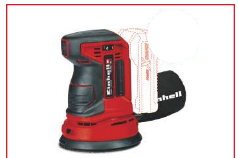
Lijadora Rotorbital de 5" TE-RS 18 Li - Solo