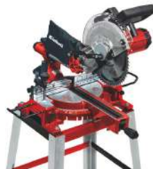
Ingleteadora de 10" TC-MS 2531/1 1900 Watts