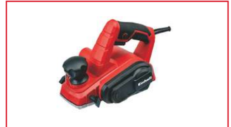
Cepillo Eléctrico TC-PL 750 750 Watts