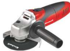
Minipulidora de 5" TC-AG 125 850 Watts