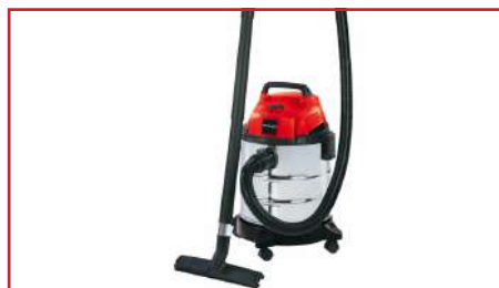
Aspiradora Seco Húmedo TH-VC 1250 S 1250 Watts