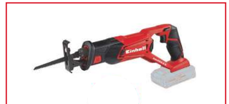
Sierra Sable TE-AP 18 Li - Solo