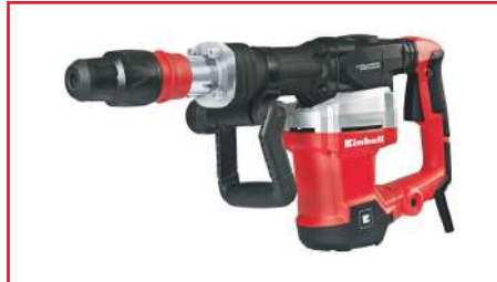
Demoledor TE-DH 1027 1500 Watts