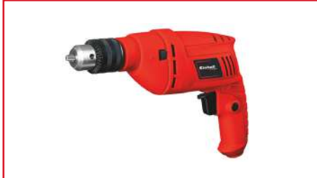
Taladro Percutor de 1/2" TH-ID 550 Watts