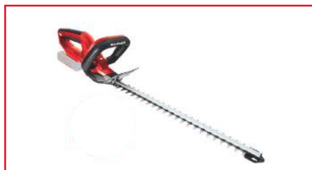
Cortasetos GE-CH 1846 Li