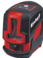
Nivel Láser TC-LL 2