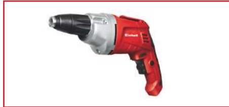
Atornillador de Drywall de 1/4" TC-DY 500E Hexa. 500 Watts