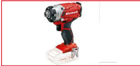
Atornillador de Impacto TE-CI 18/1 Li