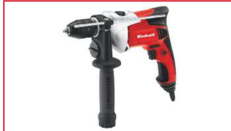
Taladro Percutor de 1/2" RT-ID 75 750 Watts