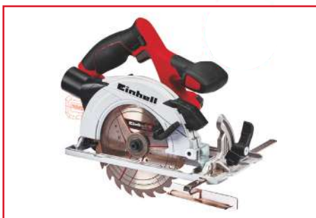
Sierra Circular de Mano TE-CS 18/165 Li - Solo