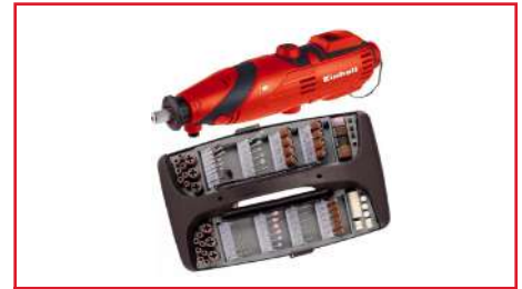
Mototool TH-MG 135 E 720 Watts