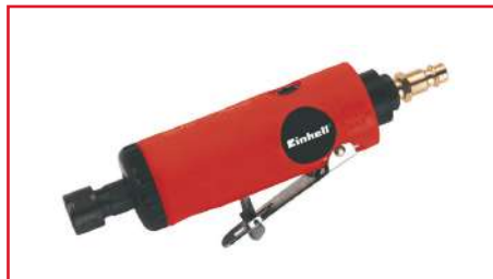
Mototool DSL 250/2