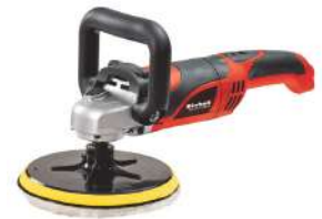
Polichadora de 7" CC-PO 1100E 1100 Watts