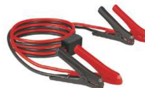
Cable Roba Corriente BT-BO 25/1