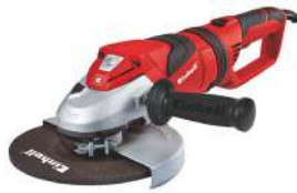
Pulidora de 7" TE-AG 180 2300 Watts