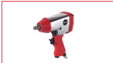
Llave de Impacto de 1/2" DSS 260/2