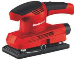
Lijadora Orbital TC-OS 1520 720 Watts