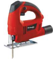
Sierra Caladora TC-JS 60 400 Watts