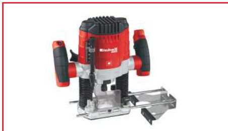
Ruteadora TC-RO 1155 E 1100 Watts