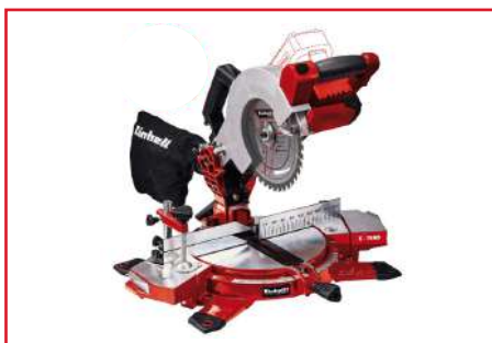
Acolilladora de 8" TE-MS 18/210 Li + Batería y Cargador