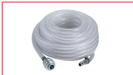
Manguera de Aire de Alta Presión