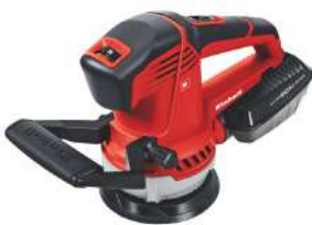
Lijadora Rotorbital de 5" TE-RS 40E 400 Watts