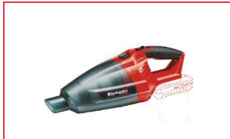
Aspiradora Manual TE-VC 18 Li