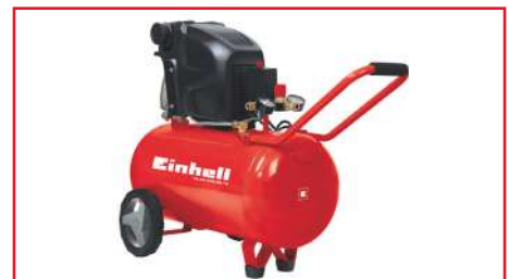
Compresor de Aire TE-AC 270/50/10 1800 Watts 50 L