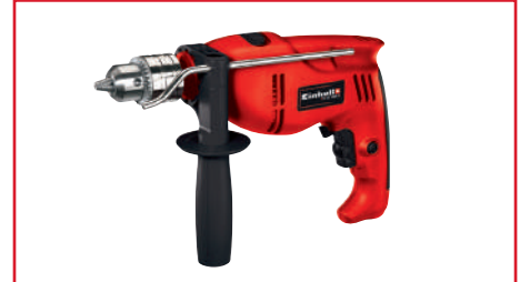
Taladro Percutor de 1/2" TH-ID 1000 Watts