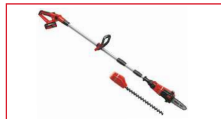
Podadora de Alturas GE-HC 18 Li T