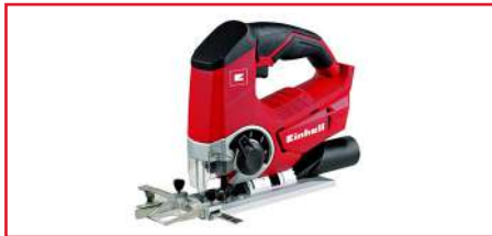
Sierra Caladora TE-JS 18 Li - Solo