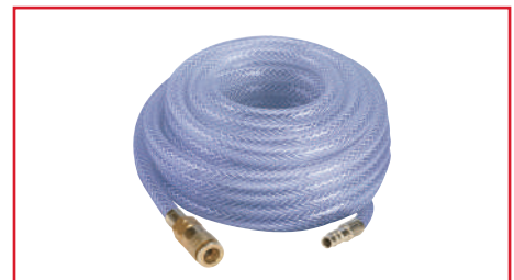
Manguera de Aire de Alta Presión

Longitud | 10 m Diámetro de boquilla | 6 mm