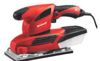
Lijadora Orbital RT-OS 30 300 Watts