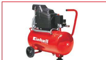
Compresor de Aire TE-AC 190/24/8 1100 Watts 24 L