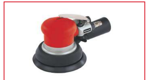
Lijadora Excéntrica DSE 125