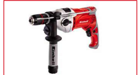
Taladro Percutor de 1/2" RT-ID 110 1100 Watts