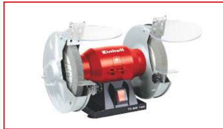
Esmeril de Banco de 5" TC-BG 150 150 Watts