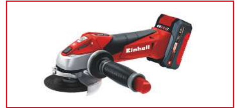
Minipulidora de 4 1/2" TE-AG 18/115 Li Kit + Batería y Cargador