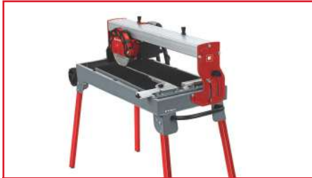
Cortadora de Cerámica de 8" TE-TC 620 U 900 Watts