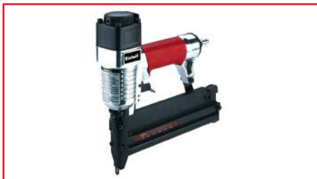
Engrapadora DTA 25/2