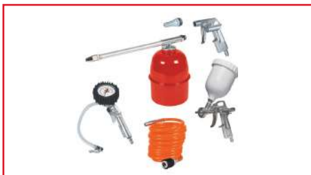
Kit para Compresor

Máx. presión de trabajo | 6.3 Pa Par de apriete | 68 Nm